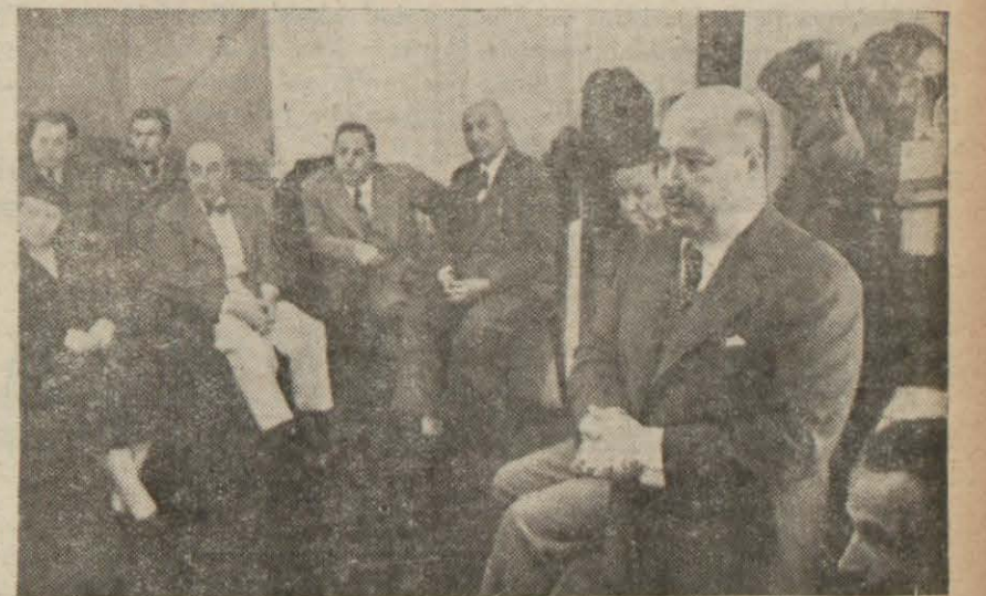
Meb'uslar Beyoğlu Halkevinde

Dün İstanbul meb'usları sabahaltın saat 10 da Şişli Halkevinde halkın derdlerini dinlenişler, buradan saat yarında Beyoğlu Halkevine geçmişlerdir.